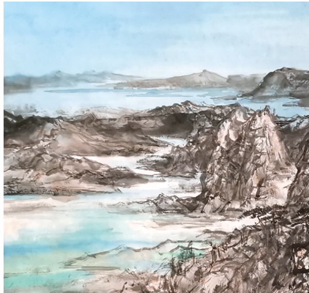
《碧海云天阔 昆嵛气象新》局部二