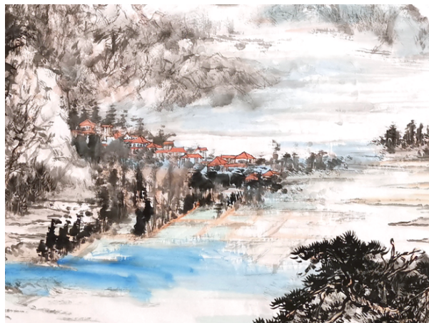
《碧海云天阔 昆嵛气象新》局部一