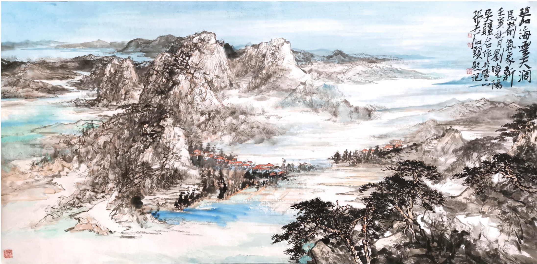
《碧海云天阔 昆嵛气象新》 张志民 刘晓阳 吴疆 248cm×124cm

为筹备“丹青绘齐鲁 时代新画卷——齐鲁书画名家主题创作展”，2022年岁末，“大众书画”专刊邀请了山东艺术学院原院长张志民先生及其学生刘晓阳、吴疆来到报社，以昆嵛山为题进行创作。他们笔下的大山是质朴的，如同一位深厚的胶东渔民，苍莽古意中几多亲切。透过画卷我们也可以看到，碧海云天万象新，山东的海滨之城焕发出蓬勃的生机。