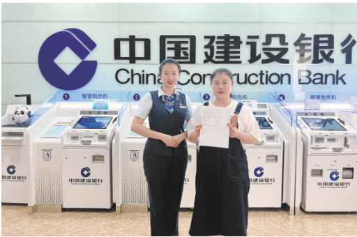
以“智慧政务”打造“15分钟便民服务区”

“裕农通”是建行将普惠金融战略向农村地区延伸、服务农民的一个重要抓手。“裕农通”叠加多重民生场景，在“裕农通”服务点，村民可以缴纳养老保险、医疗保险，POS打印缴费小票，可以查询社保卡收支记录、参保信息、缴费记录、远程问诊和网上购买药品等。