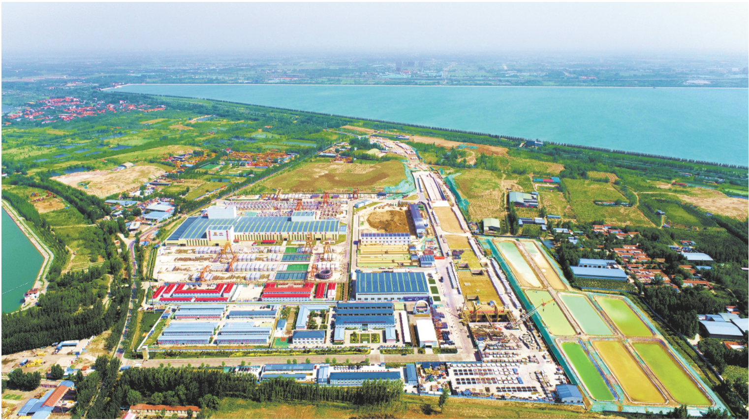
为“万里黄河第一隧”济泺路穿黄隧道建设项目提供一揽子金融服务

展等重大国家战略，全力推进普惠金融、绿色金融、科创金融、数字金融等重点工作，高效服务基础设施建设、住房租赁、乡村振兴等重点领域，通过金融科技创新持续增强防范金融风险能力，以新金融实践助推高质量发展取得新成效。