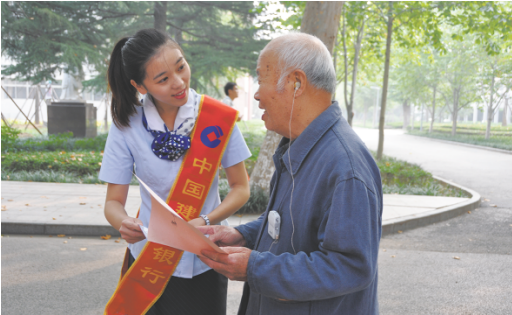
建行微蓝团队走进社区宣传金融知识

建行山东省分行研发全面风险可视化监控大屏，按照区域、业务、客户、场所、员工行为、专项风险等6个维度进行风险监控，确保做到“早发现、早识别、早预警、早处置”，这是该行建设的智能风控指挥平台的一部分。强化科技赋能，提升风控智能化水平的同时，