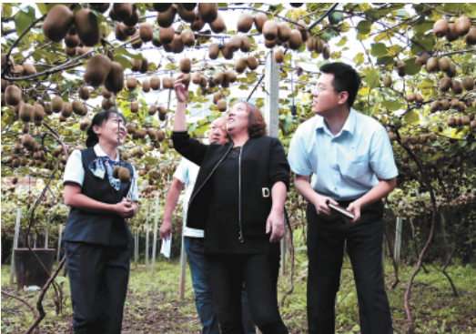
深入推广“智慧岗山”数字乡村项目，支持乡村特色产业

新的一年，建行山东省分行将进一步增强发展信心，抢抓机遇，乘势而上，回应人民期盼、服务区域发展，继续以新金融行动探索服务实体经济的新模式，为经济社会高质量发展贡献建行力量。