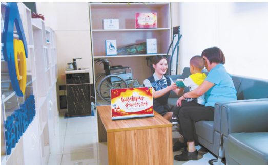
邀请客户到劳动者港湾避暑